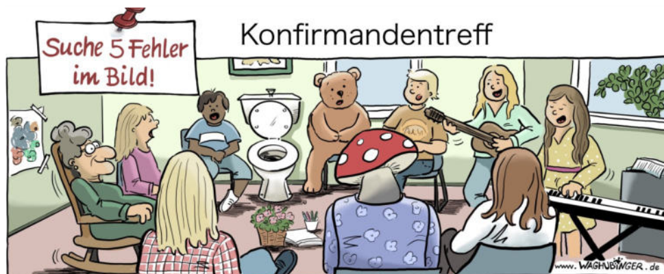
Oma, Toilette, Bär, Pilz, fehlende Klaviertasten